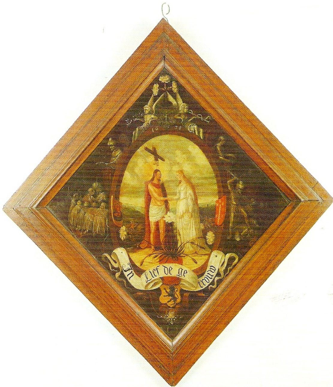
VI. Blazoembord van de Vlaamse rederijderskamer 'De Witte Angieren' te Haarlem met als devies 'In Liefde getrouw', 1638