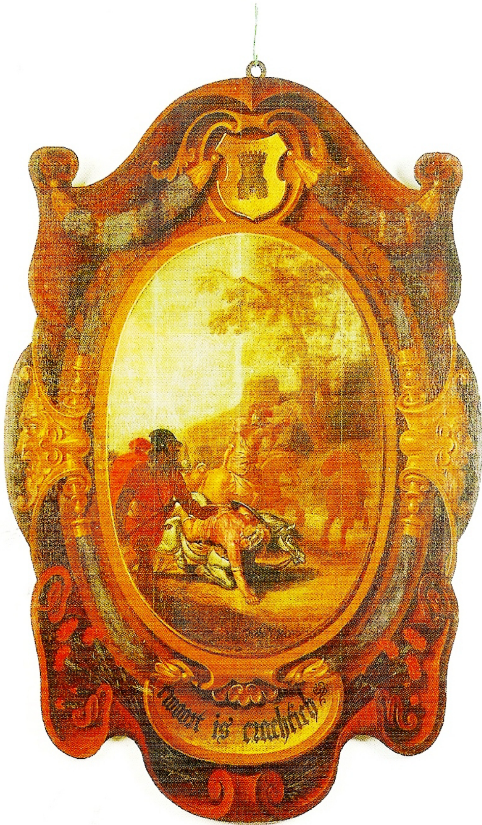
VII. Blazoensbord van de Rijnsburgse rederijderskamer 'De Roode Angieren' met als devies 't Woort is crachtich', 1638