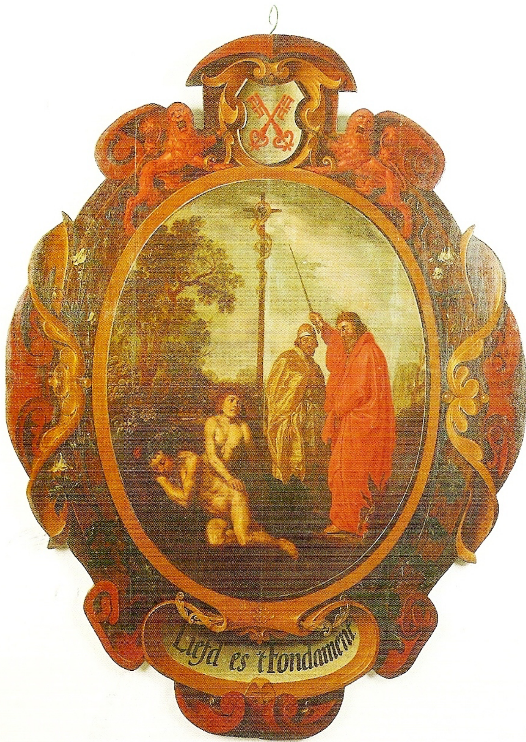
V. Blazoebord van de Leidse rederijderskamer 'De Witte Akelyen' met het devies 'Liefd es 't Fondament', 1638