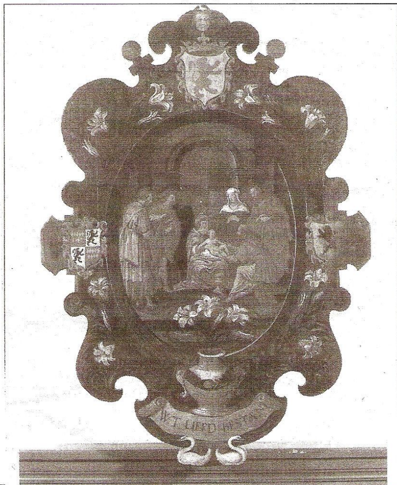
Dit blazoen dateert uit 1642. Jozef en Maria brengen hun kind naar de mokel (besnijder), die te herkennen is aan zijn lange scherpe nagels, die een kenmerk voor zijn ambt zijn. De schildering op dit blazoen is van de hand van Nicolaas Isaaczn. Van Swanenburg (Foto's uit het archief van de Sint Joris Doelen).

Twee van de in totaal zes blazoenen die bewaard worden in de Doelenzaal aan de Offemweg. De afbeelding wordt omgeven door een eiken frame met Korintische zuilen. De bovenkant is afgesloten door een sediment in segmentale vorm. Omdat de naam van de Noordwijkse Rederijkerskamer, 'De Leliken onder den Doornen', ingevolge de afleiding van het Hooglied van Salomo 2:2, als een verwijzing naar de Heilige Maagd wordt gezien, werd deze besnijdenis als één van de belangrijkste gebeurtenissen in het leven van Maria beschouwd en door de blazoenschilder afgebeeld. Het groot afgebeeld blazoen dateert uit 1550. De naam van de schilder is onbekend, maar deze moet afkomstig zijn uit de Leidse of Haarlemse School.