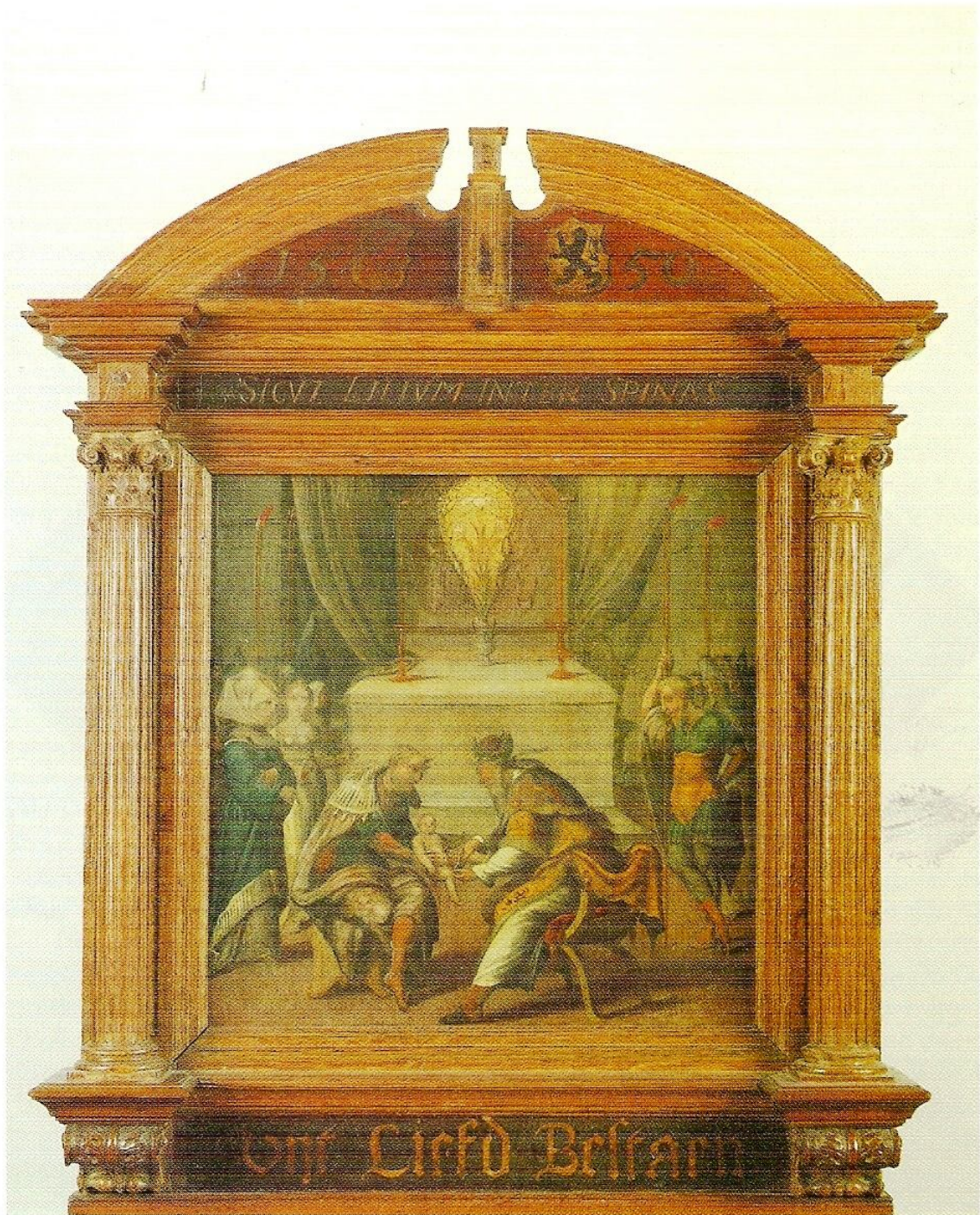
II. Blazoenbord van de Noordwijkse rederijkerskamer 'Tely onder de Doornen' met het devies 'Uyt Liefde' Bestaen', 1550